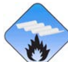
Brandklasse B1 B-s1 d0

Da PVC ein zu hundert Prozent recycelbarer Wertstoff ist, erfüllen die RENOLIT ONDEX HR Platten die Anforderungen der Nachhaltigkeit.